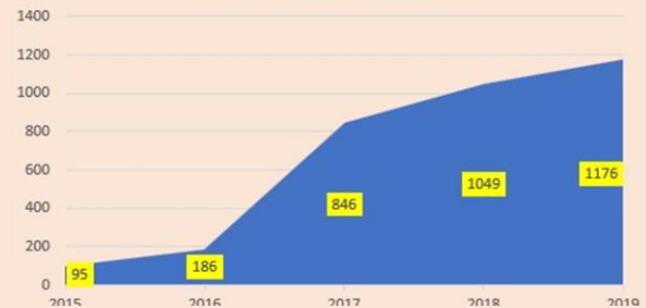
WABP Groepen Gelderland